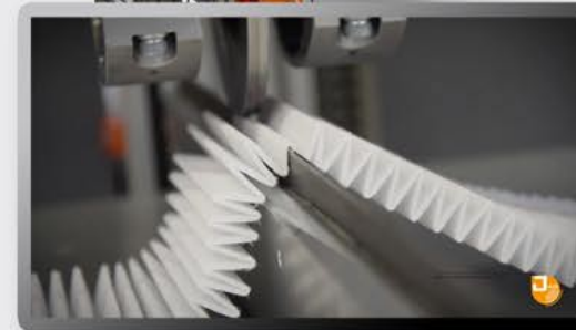
Einfaches Handling und Positionieren der plissierten Falten auf dem Ambossbalken durch pneumatisch absenkbare Bleche neben des Balkens.