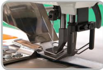
INDUSTRIAL CUSTOMIZED SEWING SOLUTIONS