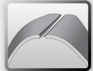
Schneiden und Kantenversiegeln der Lagen.

For more than 4 decades, the Jentschmann AG is developing and manufacturing cutting, sewing, welding and bonding plants for the manufactures of awnings, blinds and other technical textiles. Permanente innovation in cooperation with the industry as well as a high reliability and productivity of the plants, made Jentschmann AG for many years to a leading supplier with a wide product range for all significant awning manufactures. Benefit from that experience for a high security of your investment, for now and for the future.