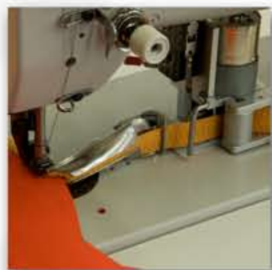
Alimentazione bordino motorizzata.