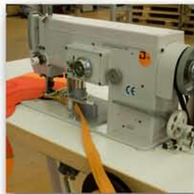
Una solida fabbricazione ne garantisce una lunga durata.

Il metodo efficiente per bordare le mantovane. Veloce e conveniente con Quick Zack™ di Jentschmann.