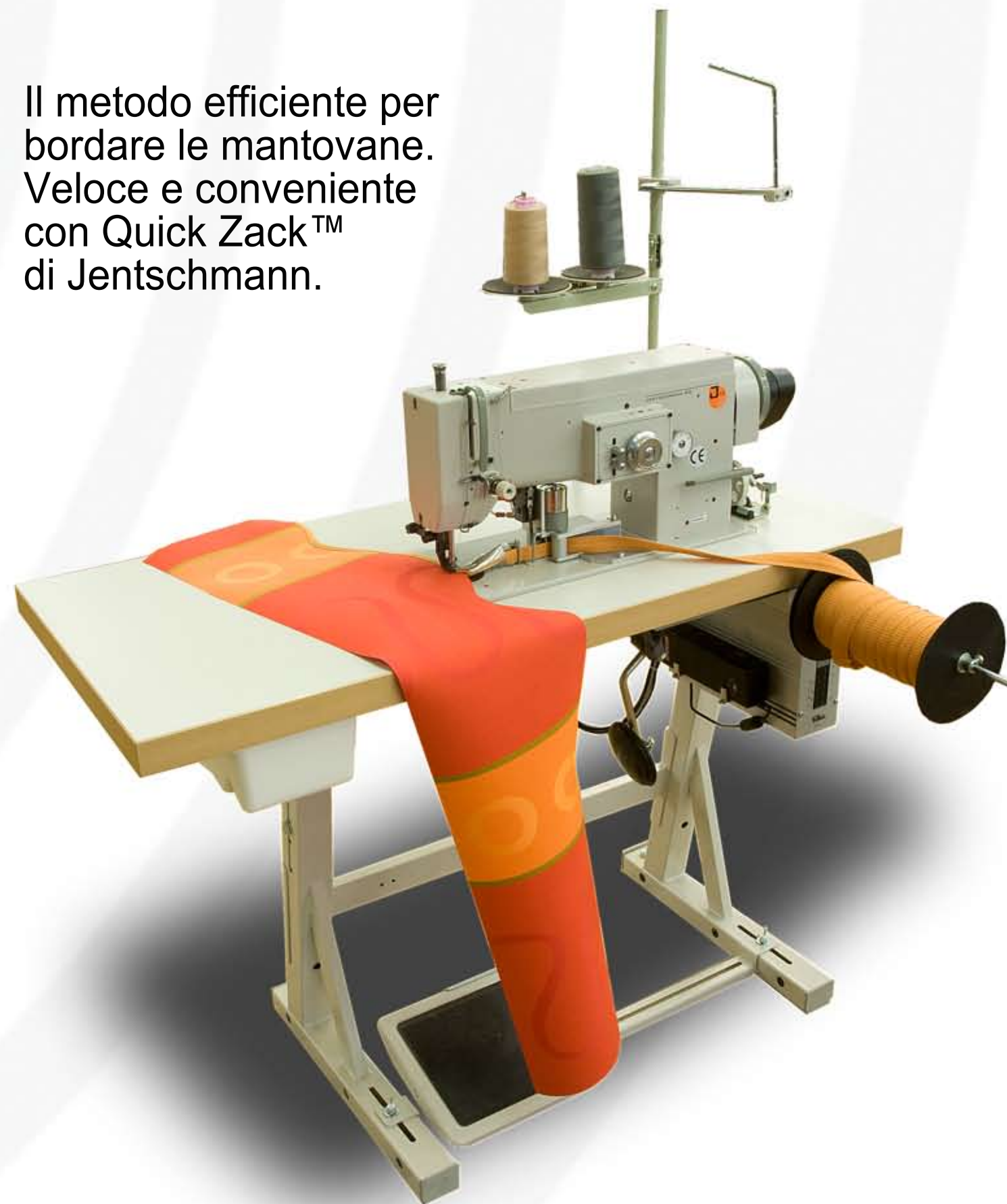
La macchina da cucire Quick Zack™ è adatta per qualsiasi cucitura a zig-zag e per bordare orli, ad es. le mantovane delle tende da sole, i tappeti, le tovaglie e le membrane di copertura.

Il metodo efficiente per bordare le mantovane. Veloce e conveniente con Quick Zack™ di Jentschmann.